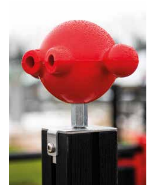
Lekytan är uppdelad i tre sektioner som tillsammans riktar sig till barn från treårsåldern upp till 12 år.

tips på bra övningar kommer det finnas en informationstavla med övningar att inspireras av. Alla redskap är beställda och arbetet börjar så snart leveransen kommer.