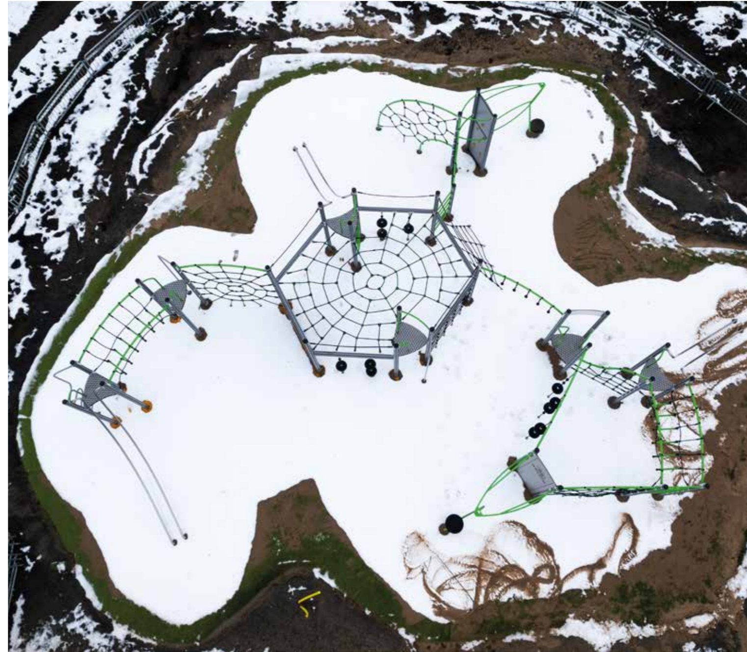
Framöver kommer det också att byggas en

Läs mer om alla lekplatser på tomelilla.se/lekplatser