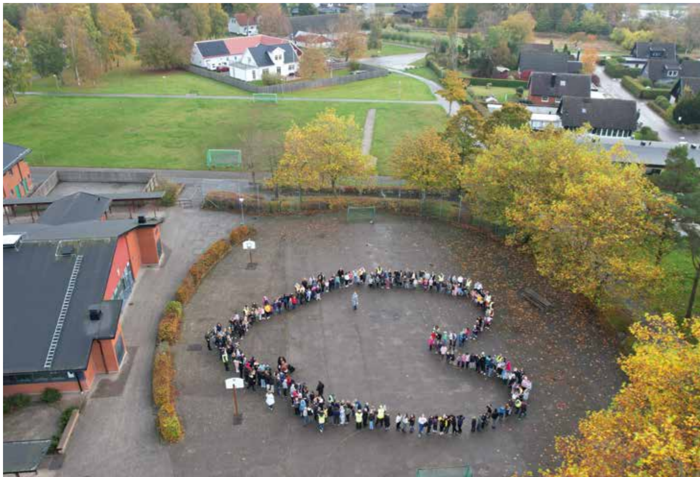
Temat avslutades på FN-dagen. På skolgården samlades hela skolan i en stor ring där barn från årskurs 3 läste upp rättigheter från barnkonventionen. Därefter bildade eleverna ett stort hjärta som en symbol för kärlek och gemenskap.