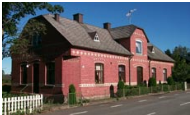
Spjutstorp 13:37, ovan, och 13:63 nedan.

Vid samhällets västra infartsväg består bebyggelsen av hus uppförda under 1920- och 30-talen. Dessa har karaktären av egnahemsbebyggelse.