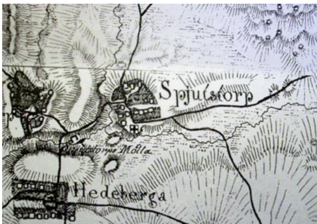
Skånska rekognoseringskartan från 1812-1820 visar hur tätt byarna låg kring Spjutstorp.

Antalet gårdar ökade kraftigt under 1800-talet och 1930 fanns cirka tre gånger så många gårdar som 100 år tidigare. Detta innebar att byn dominerade