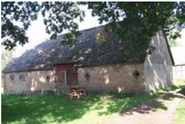
Gård Spjutstorp 10:10.

Spjutstorps bebyggelse har påverkats av järnvägens anläggande men kulturlandskapet i hög grad av skiftesreformen under 1800-talet. Efter 1930 har uppodlingen stannat av och andelen åker är ungefär samma idag som då. Däremot har det efter 1930 skett flera utslagningar och sammanslagningar av jordbruksföretag. Trots det finns det idag fortfarande kvar 17 gårdar (enligt SCB), det vill säga ungefär lika många gårdar som för 300 år sedan. Större delen av jordbruken i Spjutstorp är därmed än idag småbruk. Endast fyra av gårdarna har arealer på över 50 ha. Detta bekräftas vid kartstudier då man kan notera att endast ett fåtal fastigheter har sammanslagits på